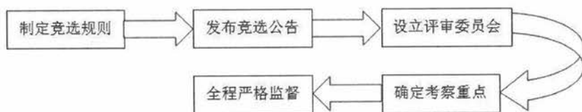
图2 竞争方式选任重大复杂破产案件管理人实操细则示意图

(5) 全程严格监督。做好内部监督，评审过程必须邀请纪检监察部门人员全程参与。做好社会监督，评审结果及时公示公告，接受社会监督。做好信息保存，评审过程全程录音录像，全部资料建档备查，并在法官工作平台进行登记备案。 ②